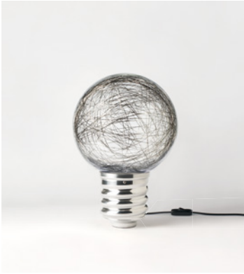
NEPT-FP2101 ALUMINIUM POLI POLISHED ALUMINIUM