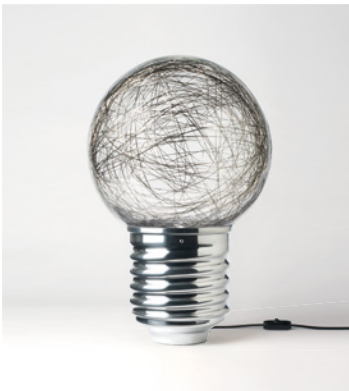
NEPT-FP1101 ALUMINIUM POLI POLISHED ALUMINIUM