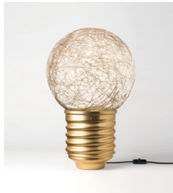
NEPT-FP11C2 OR GOLD