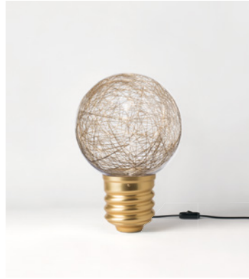
NEPT-FP21C2 OR GOLD